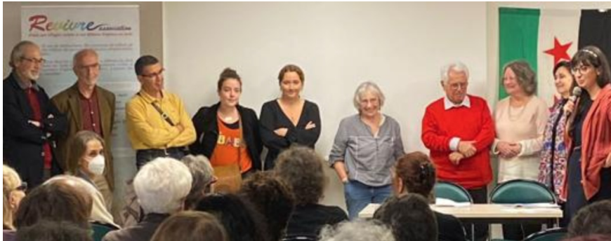
Le nouveau conseil d'administration 2022

Rendez-vous début 2023 pour le vote à l'Assemblée Nationale de cette nouvelle Loi !