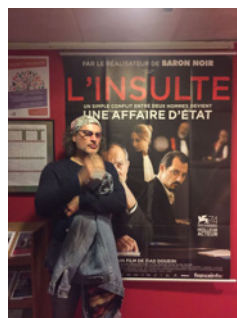
Festival des cinémas du Magreb & Moyen Orient, participation de Revivre